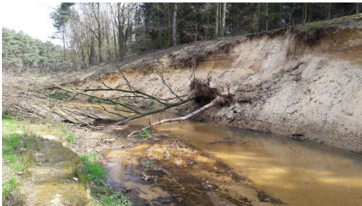
De Everlosebeek is vanaf het Koelbroek tot aan de monding in de Maas ecologisch heringericht. Hoewel de beek ten noorden van het Koelbroek in de jaren '70 verlegd is naar het dekzandgebied en daarbij diep is ingegraven, meandert ze er sinds 2016 duchtig op los. Omdat er hier geen wateroverlast kan voordoen, kan de beek zich natuurlijk ontwikkelen en zijn invallende bomen geen probleem. Ijsvogels en oeverwaluwen en grote gele kwikstaart, typische beekvogels, hebben hier sinds de herinrichting al gebroed. Bij hoge afvoeren heeft het water de ruimte en draagt het gebied bij aan buffering van water.