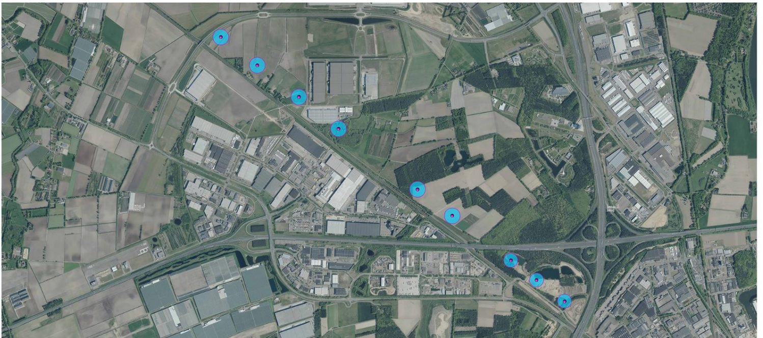
Onder : Geplande plekken voor windmolens