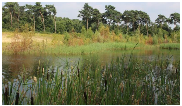
Links: Opening fietstunnel onder spoorlijn onder spoorlijn naar Eindhoven. Voor fietsers is het soms nog behelpen om de werkplek te bereiken. Rechts: plas in Groeve Hecker tegen klaverblad Zaarderheike. Hoewel ongronding als middel voor natuurontwikkeling in dit voormalige stuifzandgebied discutabel is, hebben de plassen een goede waterkwaliteit, gevoed door grond- en regenwater.