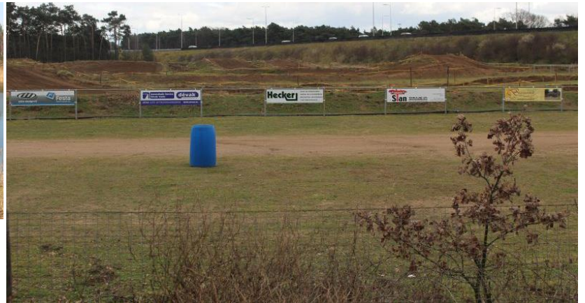
De ontgronder wil de plassen opvullen met vervuilde grond. Helemaal vreemd in de Ecologische Hoofdstructuur maar wel een gebruikelijke en belangrijke inkomstenbron van ontgronders. Helaas is één plas zo al grotendeels gedempt. De ontgronder heeft als hobby ogenschijnlijk motocross. Er wordt veelvuldig in de ontgronding gecrosst, de ontgronder maakt reclame in het aangrenzende crossterrein.